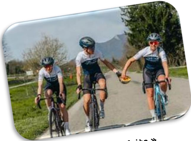
Les coureurs ont « la frite »

Vous pourrez encourager les coureurs tout au long de la journée et les attendre en dégustant un repas « brasserie ».